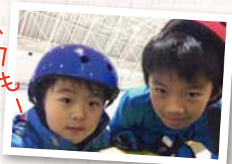
さーたらーるてーたいやう

「明日、何時だったけ？」「だから！9時集合だって！ちゃんと聞いててよ！」「おう・・」明日、パパは久しぶりの1日オフ。野球チームの子供たちと、スケート体験に参加です。一方、ママは友人の結婚式に御呼ばれです「結婚式って何年振りかしら！」と大はしゃぎ。数日前からソワソワです。