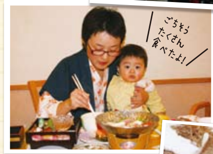
◆豪華な食事に囲まれたママとお兄ちゃん