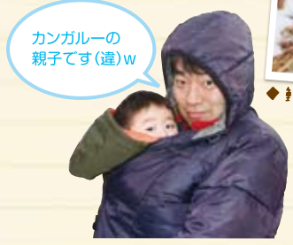
カンガルーの親子です(違)w